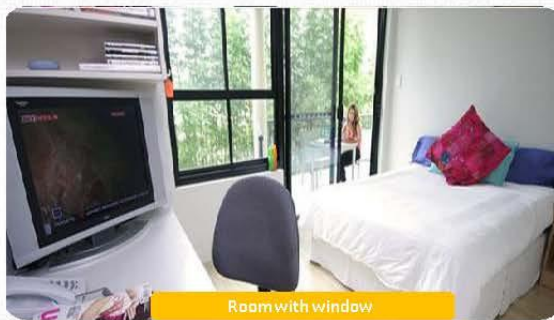
Room with window