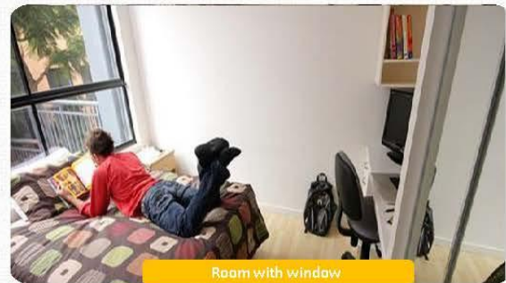
Room with window