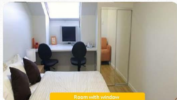
Room with window