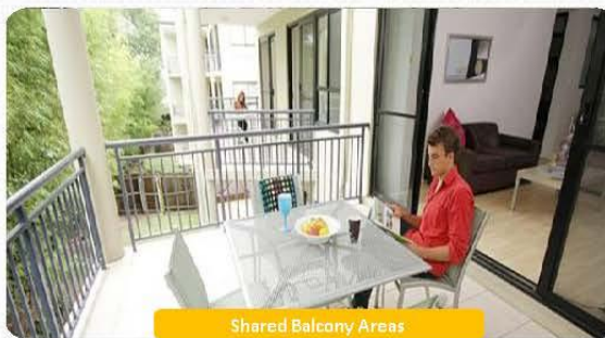
Shared Balcony Areas