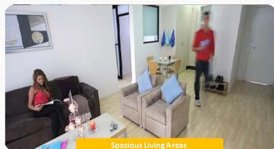
Spacious Living Areas

"Any prices are subject to change at the discretion of International House Brisbane - ALS management without notice"